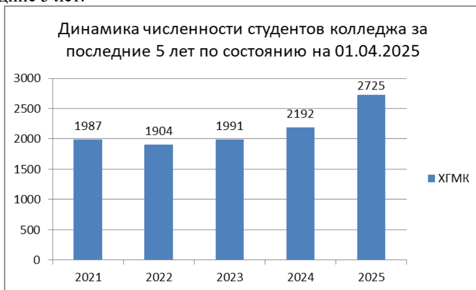
Рисунок 1 – Динамика численности студентов Колледжа в 2021-2025 гг.

На рисунке 1 представлена динамика численности студентов Колледжа за последние 5 лет.